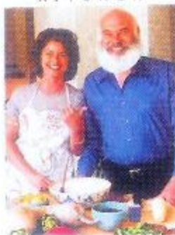
SECRET FORMULA REVEALS HOW TO LIVE HEALTHY AND HAPPY

ANDREW WEIL, M.D. 《The Healthy Kitchen》by Andrew Weil